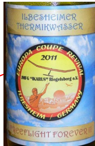
+ legendäre Flasche Ilbesheimer Thermikwasser

Ein großes Dankeschön geht an die DHP Gremium Mitglieder für die geleistete Arbeit im abgelaufenen Jahr 2015 !