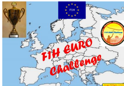
FIG und FIH EURO Challenge (HEC)